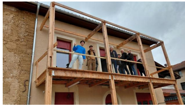
●●● Visite du bâtiment lors de l'événement organisé pour la signature de la charte partenariale entre Pluralis, la commune, l'EHPAD et Tero Loko.

Lors de cette visite, les partenaires, ainsi que les représentants du Département, ont pu découvrir les 7 futurs logements qui seront livrés dans quelques mois : 3 logements pour des personnes âgées, 2 logements sociaux de « droit commun », et 2 autres loués à Tero Loko en intermédiation locative.