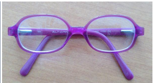
●●● Une petite frimousse plisse les yeux en attendant de me retrouver ! Je suis disponible en mairie, aux horaires d'ouverture au public.

Pour ce premier Bistr'Osier du nouveau mandat, on tente un nouvel horaire : le vendredi soir. Le principe, lui, ne change pas : en l'absence d'un bistrot où se retrouver, c'est la maison commune qui se transforme en troquet. Apportez ce que vous avez envie de partager, à boire ou à grignoter, mais aussi vos plus belles idées pour notre village ! RDV le vendredi 24 avril à partir de 18h30 en mairie !