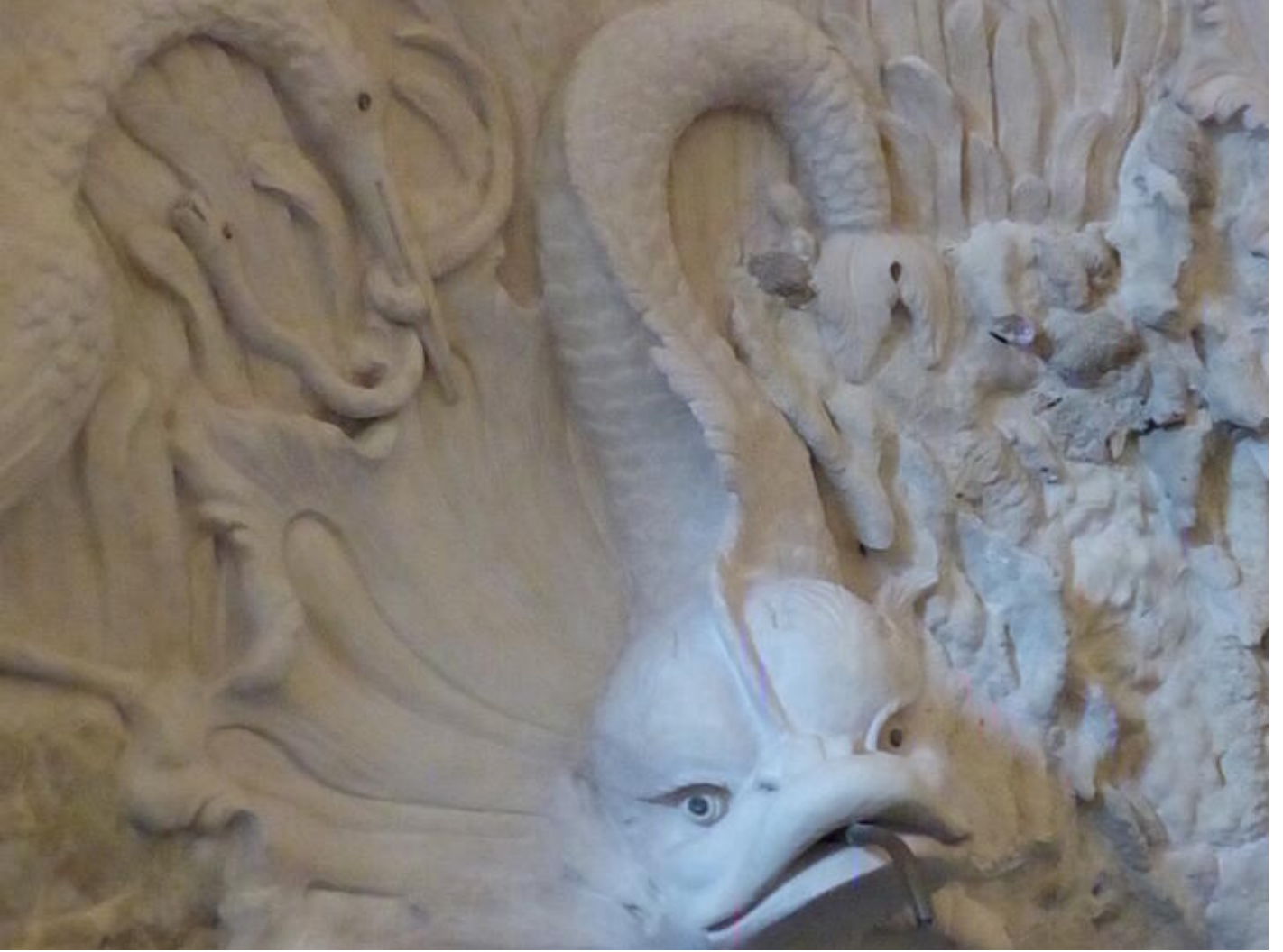
Visite guidée Saint-Antoine au fil du temps - Le temps des bâtisseurs : splendeurs du gothique